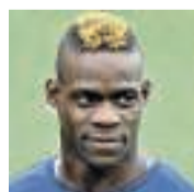
Mario Balotelli.

nalelf mit einem Sieg gegen Costa Rica die letzte Chance auf das Achtelfinale bei der WM rettet. Ob sie ihm den Wunsch erfüllt hätte, bleibt ein Geheimnis: Costa Rica bezwang Italien mit 1:0.