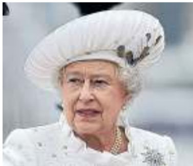
4 „Das ist mehr eine Kappe als ein Hut. Die Krempe steht hier nach oben ab, der Schmuck dekoriert das Ganze. Das Gesicht ist hier aber sehr gut zu erkennen“, sagt Porwoll anerkennend.