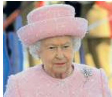
2 „Die Krempe ist hoch aufgeschlagen und sehr dicht am Kopf. Das Muster des Mantels wurde auf den Hut übernommen. Es ist der gleiche Stoff für beide Teile verwendet worden.“