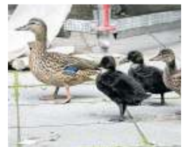
Die Polizisten in Frankfurt retteten eine Entenfamilie wie diese.

Eine Entenfamilie hat sich in Frankfurt verirrt und ist zu einer Polizeistation gewatschelt. Die Mutter und ihre zehn Küken saßen am Sonntag vor der Tür der Wache, berichtete das Polizeipräsidium gestern. Die Beamten der Station in einem Einkaufszentrum setzten die Vögel in Kästen und fuhren sie zu einem nahen Bach. Dort wurden die Tiere wieder in die Freiheit entlassen. dpa