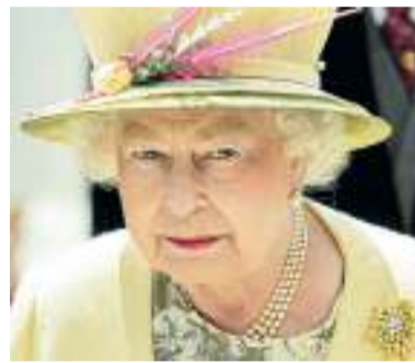
3 „Ein sehr stattlicher Anblick! Tolle Farbabstimmung mit der Jacke. Die eingeschnittenen Federn stehen im perfekten Zusammenspiel mit der Bluse. Der Hut ist aus Sisol gefertigt, ein sehr leichtes Material.“