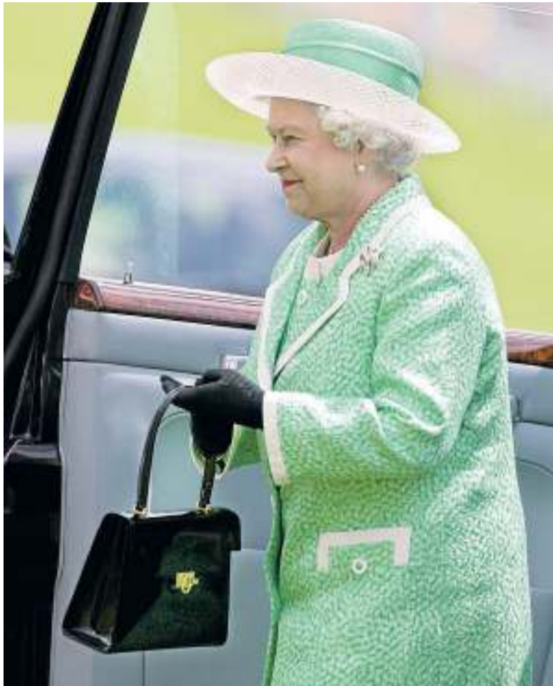
1 „Ein zweifarbiger Hut, eigentlich eher selten für die Queen. Hut und Krempe bestehen aus zwei unterschiedlichen Materialien, oben Sisol, unten eine Art Exoten-Stroh. Schlicht gemacht, aber trotzdem hübsch“, sagt Porwoll.

In ihrer Werkstatt im Braunschweiger Magniviertel finden sich diverse Entwürfe, Rohlinge und Formen für Hüte und Mützen. Die Hüte würden, so Porwoll, ganz unterschiedlich verwendet. Im Sommer würden oft Anfertigungen als Schmuck in Auftrag gegeben, im Winter handle es sich um schlichtere Kopfbedeckungen zum Schutz der Haare.