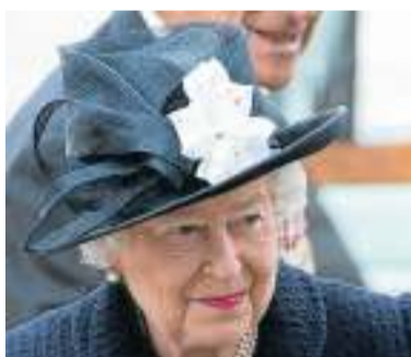
6 „Hier wirkt die Queen sehr jugendlich. Die weiße Blüte symbolisiert Lebensfreude. Der lockere Knoten und die ovale Form des Hutes vermitteln Frische.“