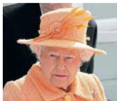
7 „Orange ist eine sonnige Farbe. Der warme Tweedmantel und die Farbe erinnern an Frühling. Der Kopf des Hutes ist zylindrisch- asymmetrisch. Durch die gefärbten Gänsefedern passt das aber zueinander.“