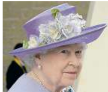
5 „Eine Ausnahme der Farbe. Der Hut ist etwas dunkler als die Jacke. Allerdings hellen die Seidenblumen die Erscheinung auf. Die Jacke ist etwas blass, wirkt aber durch den farbvolleren Hut lebhafter.“